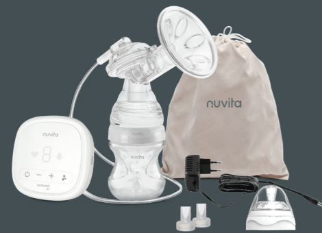
Mod. MATERNO GO