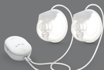
Nuvita 1288W Materno Smart Wear Doppio