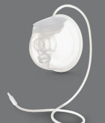
Nuvita 1287KDW Materno Smart Wear Kit Doppio