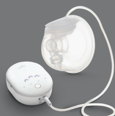
Nuvita 1287W Materno Smart Wear