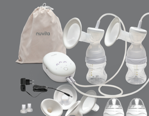
Mod. MATERNO SMART X DOPPIO

DE MATERNO SMART von Nuvita ist das erste und einzige „Ökosystem“ bestehend aus Produkten und Zubehörteilen, die miteinander kombiniert werden können, um das Stillen praktischer und einfacher zu machen.